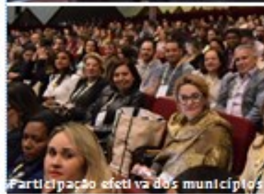
Participação efetiva dos municípios ajuda a definir estratégias da Saúde