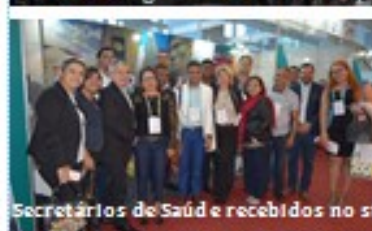
Secretários de Saúde e recebidos no stand da Região Norte pela equipe Coasesms