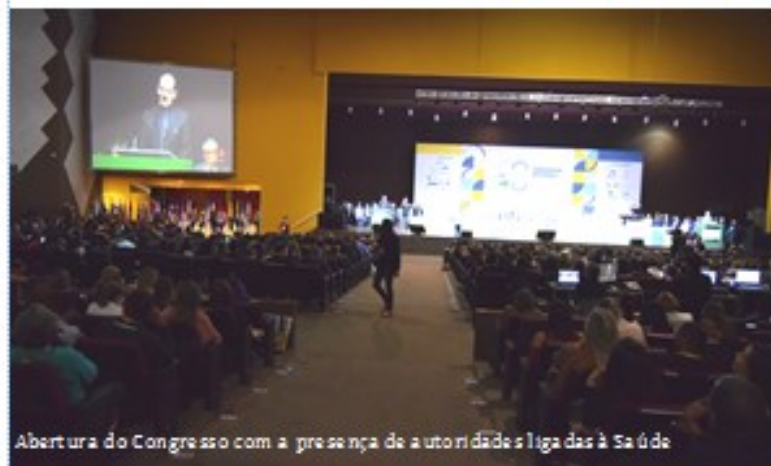
Abertura do Congresso com a presença de autoridades ligadas à Saúde