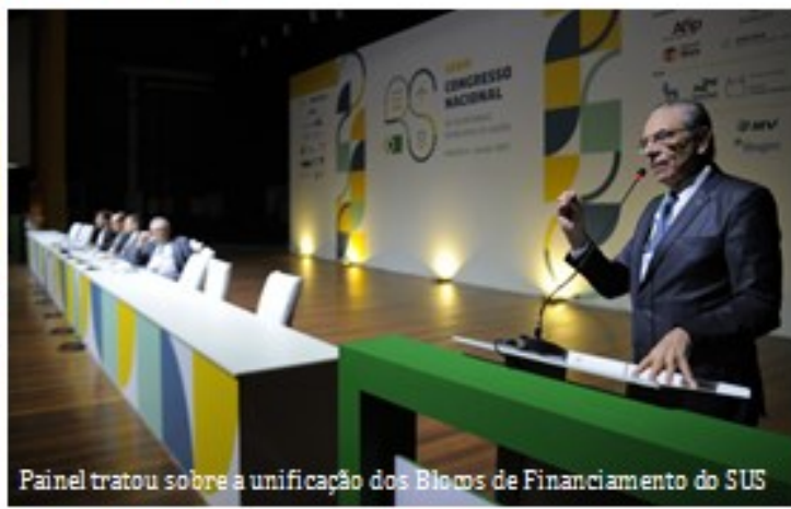
Painel tratou sobre a unificação dos Blocos de Financiamento do SUS