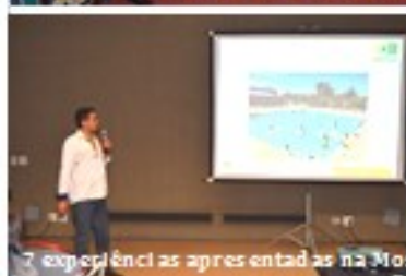
7 experiências apresentadas na Mostra e equipe de apoiadores e destaque