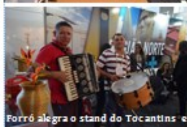
Forró alegria o stand do Tocantins e chama atenção durante o congresso