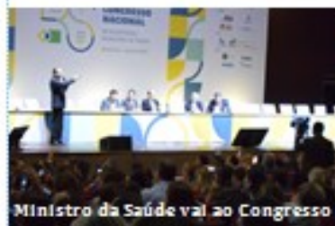
Ministro da Saúde vai ao Congresso e anuncia ações e recursos para Saúde